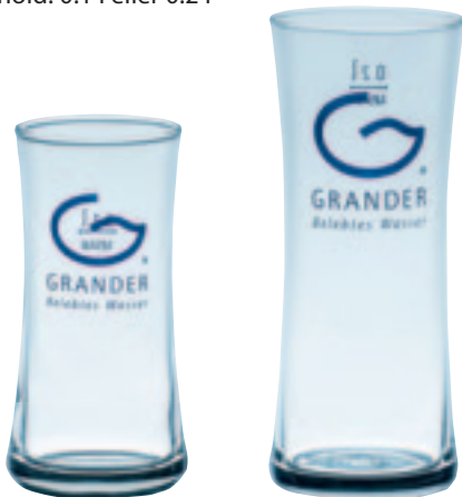
GLSEKB / 0,1 l

Med blå print. Sælges i boks med 6 stk. Indhold: 0.1 l eller 0.2 l