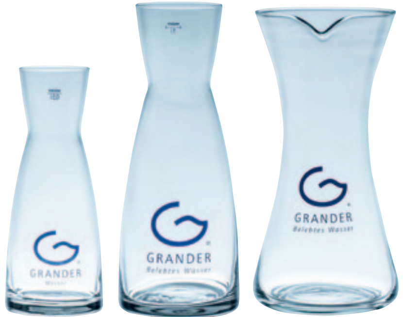
WK03K / 0,5 l